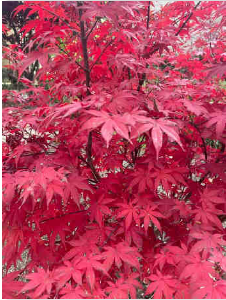
Lovely fall Colours