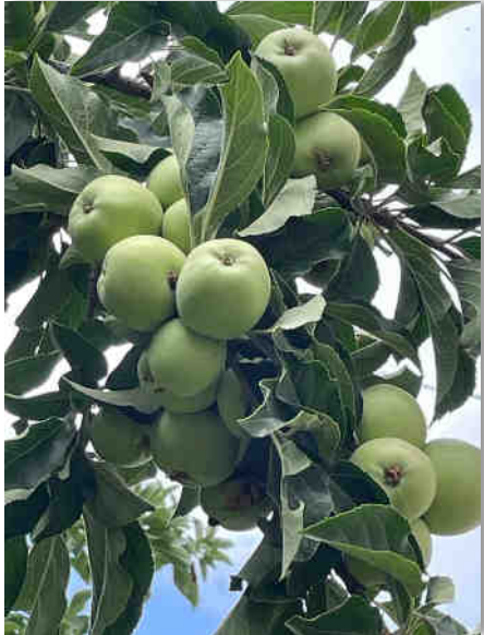
Leh special green apple