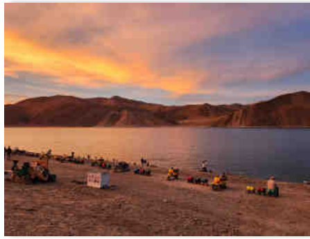
Mesmarising Pongong Lake