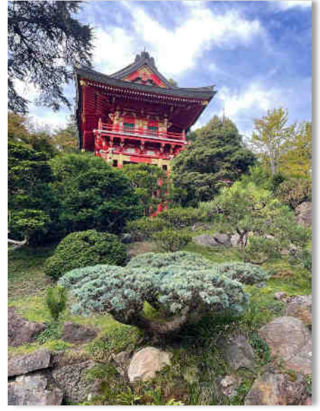
Japanese Tea Garden, SF