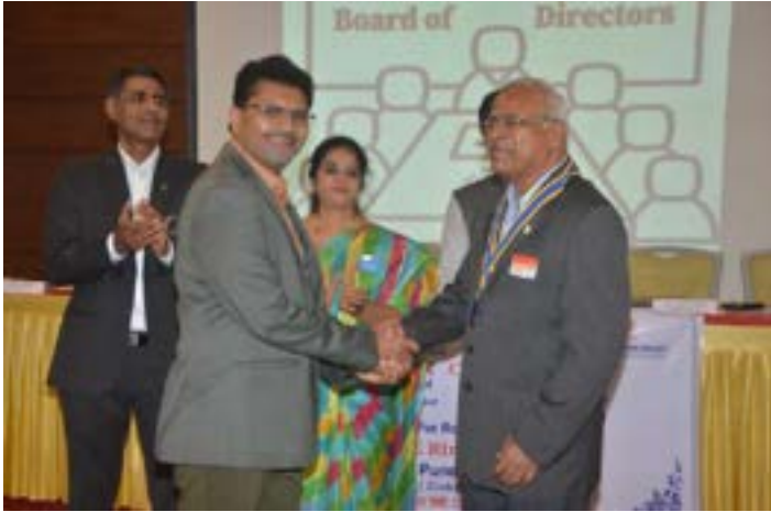
Handing over of charge to Secretary