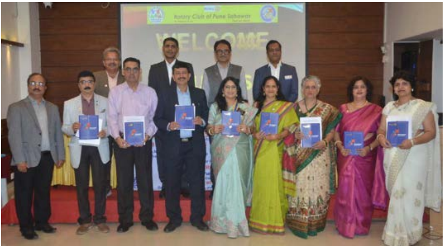
Induction of New Members...