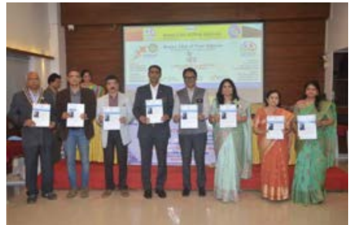
Maitra Bulletin Publication