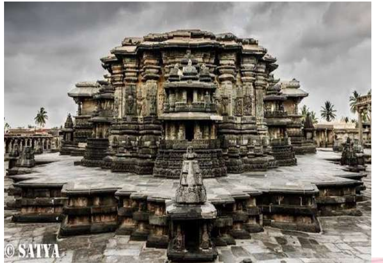
बेल्लुरचे चेन्नकेशव मंदिर

एकूणच आपण जेव्हा एका मंदिरामध्ये प्रवेश करतो तेव्हा आपल्या प्राचीन हिंदू व भारतीय संस्कृतीचे महाकाय दर्शनच आपल्याला होते फक्त त्या श्रद्धेने व उत्सुकतेने आपण त्यावर नजर फिरवली पाहिजे इतकेच!