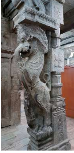
व्याळ (सिंह हत्ती घोडा)

३. गजदळ किन्वा हत्ती हे पण ऐश्वर्याचे महानतेचे रूपक आहे. लक्ष्मीच्या ऐश्वर्यरूपामध्ये तिच्या दोन्ही बाजूंनी हे गज जलाभिषेक करत असतात असे चित्र आपण नेहमीच बघतो. हत्ती म्हणजे महाकाय सत्ता सामर्थ्य आणि संस्कृती रक्षण