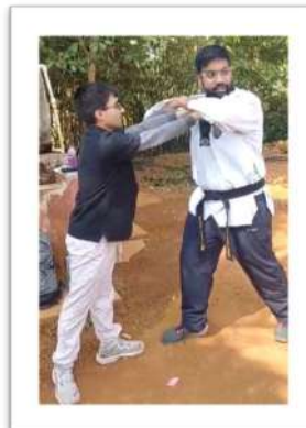
Live demonstrations of basic self-defense