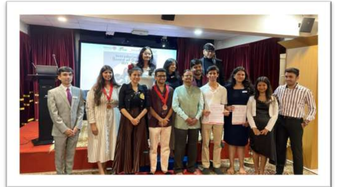
Installation of Rotract Club Of Pune Pride