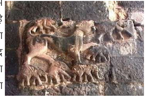
शारभ ( शनिवारी वाडा)