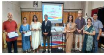
PHF, PHF+ PHF++ RY 2023-24